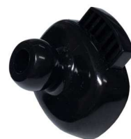
エアコン吹出口 ホルダー